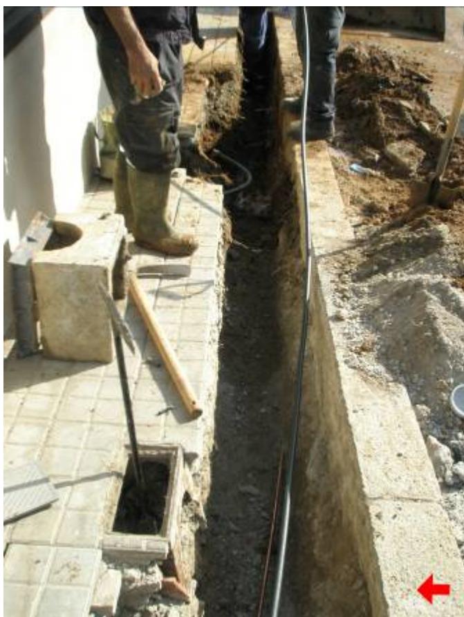
Tram de la Rasa 100 on apareixien els serveis