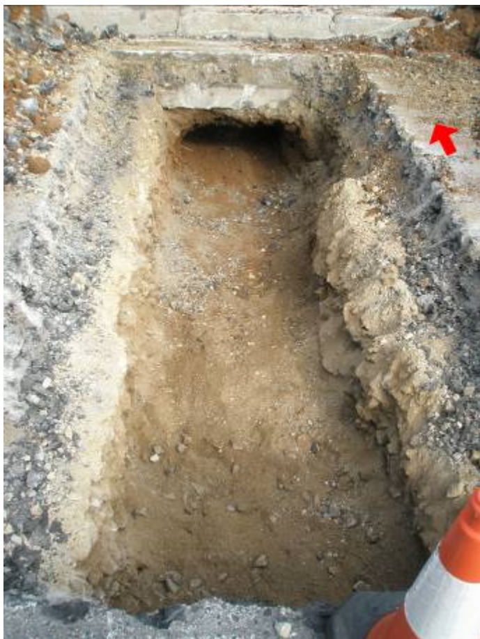
Tram Rasa 200