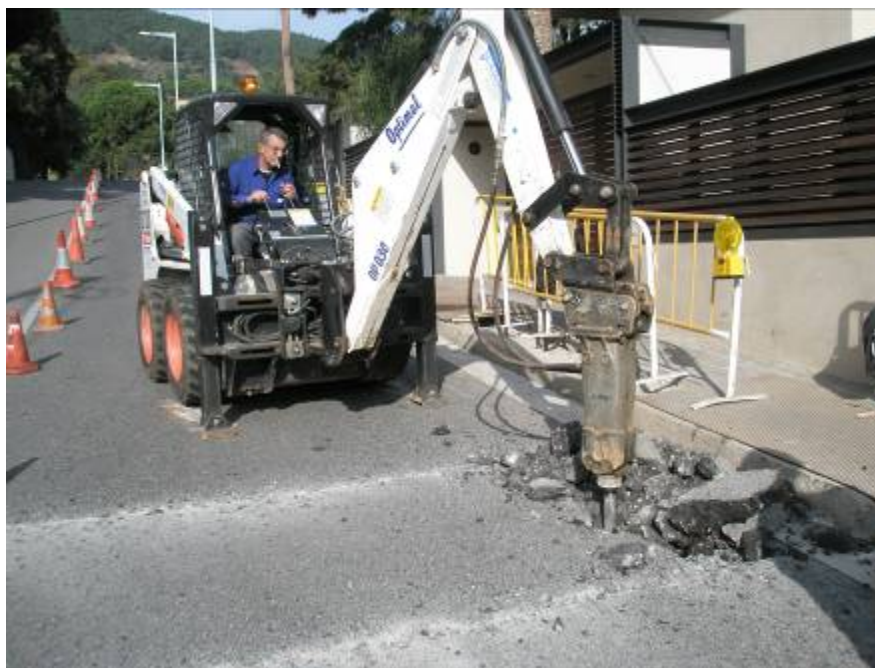
Obertura Rasa 200