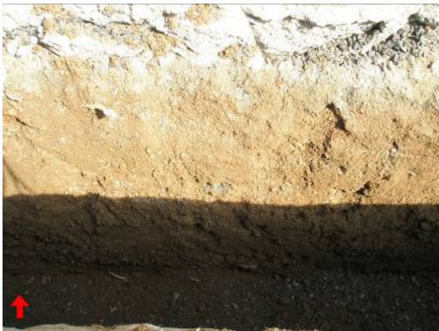
Perfil Rasa 100