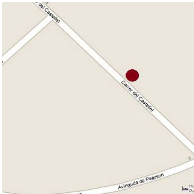
Situació de la intervenció al carrer del Castellet